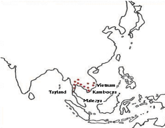
Şekil 3. Betta splendens 'in doğal yayılım alanı (Linke, 1980)

Betta splendens 'in doğal yaşam ortamı Güneydoğu Asya'dır. Tayland, Malezya, Kamboçya, ve Vietnam'daki su kaynaklarında yaygın olarak bulunurlar (Şekil 3). Nispeten düşük oksijenli sulara yaşayabilir ve üreyebilirler. Daha çok tabanı çamurlu ve su bitkilerince zengin sığ suları severler ve sulama kanallarının sıcak bölgelerinde de bulunabilirler (Friese, 1980; Linke, 1980).