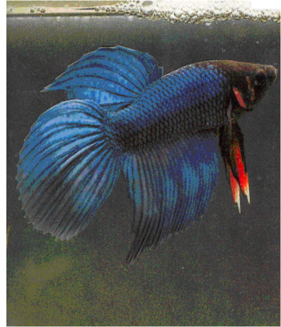
Şekil 1. Erkek Betta splendens (Schmitz, 1974).

B. splendens 'lerin yaşamlarında solunuma yardımcı organ çok önemli bir yer tutar. Bu organ sayesinde küçük bir bardak suda dahi belirli bir süre yaşayabilirler (Geldiay, 1985).