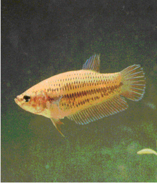
Şekil 2. Dişi Betta splendens (Schmitz,1974).