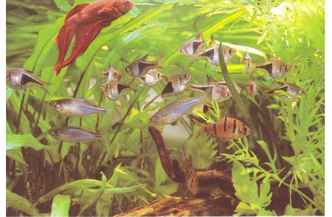
Şekil 4. Betta splendens diğer balıklarla birlikte (Axelrod, 1987).

B. splendens 'ler sakin huylu balıklarla aynı akvaryumda tutulabilirler (Şekil 4). Ancak, bu gibi durumlarda da özellikle erkek B. splendens 'lerin yüzgeçlerinin uzun ve gösterişli olması nedeniyle diğer balıklar tarafından saldırıya uğradıkları görülmektedir (Jaroensutasinee ve Jaroensutasinee, 2001a; Jaroensutasinee ve Jaroensutasinee, 2001b).