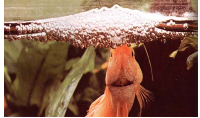
Şekil 5. Köpük yuvayı tamamlamış bir Betta splendens erkeği (Axelrod, 1987).

Bir B. splendens 'in yaşam öyküsünün temeli su yüzeyinin hemen altında erkek tarafından oluşturulmuş köpük yuvalar ile başlar (Şekil 5). Hava kabarcığı (köpük) şeklindeki bu yuvayı erkek ağzından solunum yaparken dışarı bıraktığı hava ile oluşturur. Aynı zamanda bu hava ağızdan dışarı verilirken, bu hava ile birlikte ağız içerisinde bulunan ve yapışkan özellik taşıyan salgı da dışarıya verilir. Bu sayede yuvalar biri birine yapışık olarak kalırlar. Bu da yuvaların daha uzun süre bozulmadan kalmasını sağlar. Erkeklerin bu yuva oluşturma özellikleri, normal üremelerinin meydana geldiği genellikle su sıcaklığının 25-27 °C olduğu zaman gerçekleşmektedir (Linke, 1980; Axelrod, 1987).