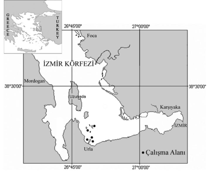
Şekil 1. Denemelerin gerçekleştirildiği çalışma bölgesi.

İzmir Körfezi'nde Eylül 2003-Kasım 2004 tarihleri arasında "Barış" adlı ticari balıkçı teknesi ile toplam 25 balıkçılık operasyonu gerçekleştirilmiştir.